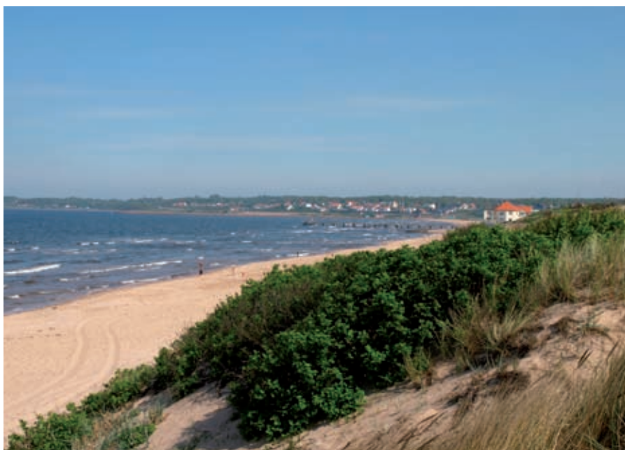
En del av Ängelholms 6 kilometer långa sandstrand.

I Ängelholm fokuserar vi på hållbar utveckling och vi vill ligga i