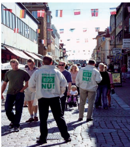
Handelskammaren bedriver opinionsarbete för bättre infrastruktur, på bilden gäller det E22.

Även om kung Carl XVI Gustaf kunde påskynda Europakorridorens tillkomst vore det sannolikt i strid med grundlagen. Men när ett år gamla Sydsvenska Industri- och Handelskammaren 1906 ville etablera en snabbare förbindelse mellan Malmö och Tyskland än den existerande ångbåtsförbindelsen vände man sig till Oskar II. Och arbetet kröntes med framgång, tre år senare hade förbindelserna utvecklats och svarade bättre mot företagets behov.