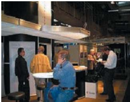
Europakorridorens monter var välbesökt på Elmia Nordic Rail.

"Infrastrukturen ska länka ihop Sverige – mellan regioner och grannländer" ur Regeringsförklaringen 2003